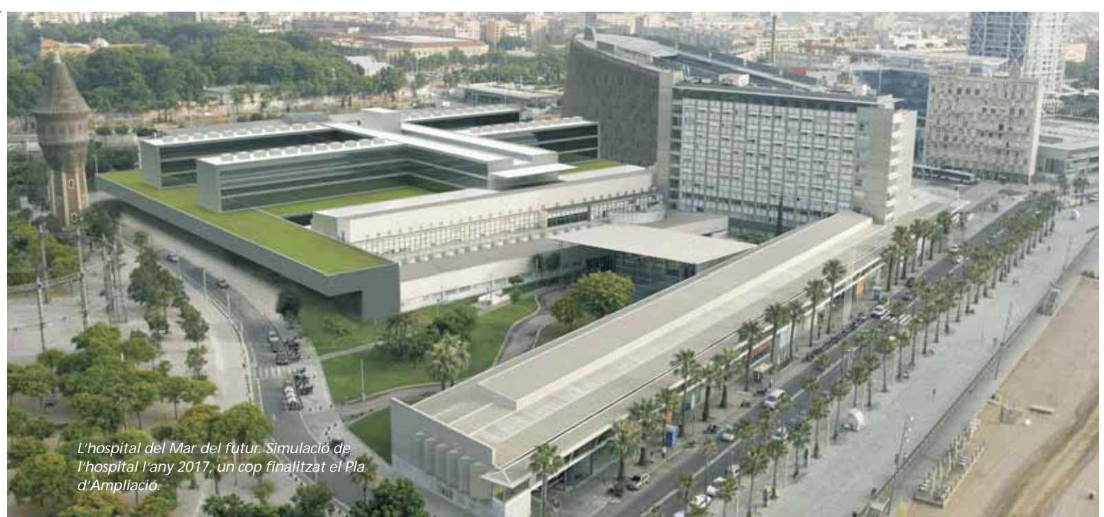
L'hospital del Mar del futur. Simulació de l'hospital l'any 2017, un cop finalitzat el Pla d'Ampliació.