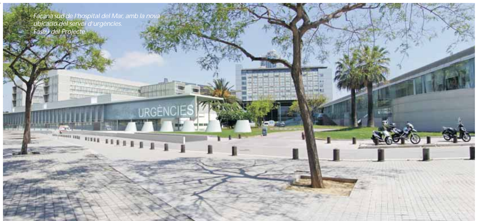
Façana sud de l'hospital del Mar, amb la nova ubicació del servei d'urgències. Fase 1 del Projecte.